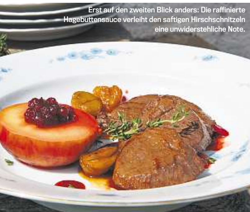
Erst auf den zweiten Blick anders: Die raffinierte Hagebuttensauce verleiht den saftigen Hirschschnitzeln eine unwiderstehliche Note.