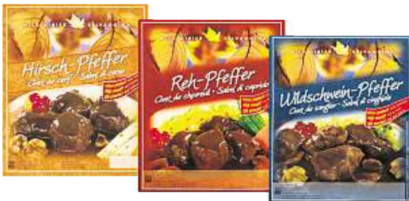
Hirschpfeffer, Schale à 600 g, Fr. 19.90, Rehpfeffer, Schale à 600 g, Fr. 23.90, Wildschweinpfeffer, Schale à 600 g, Fr. 19.80.

Das mit der Jagd ist so eine Sache und mit dem Treffen sowieso. Also lässt man es lieber gleich bleiben und greift auf die Beute im Migros-Regal zurück. Bequemer, schneller und sicherer ist das allemal. Gleich mehrere Sorten Wildpfeffer bietet die Migros dem eiligen Esser an: vom Hirsch, Reh, Wildschwein und mehr. Schmeckt wie bei Muttern und ist garantiert bleifrei.