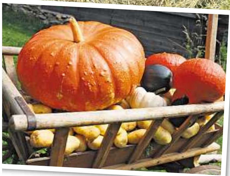
Für den Transport kommen Kürbis, Kartoffel und Co. in den Leiterwagen. Später gehts in die Küche und in den Keller.

«Unser Erfolg basiert nicht auf Agraraktien, sondern auf Nachhaltigkeit.»