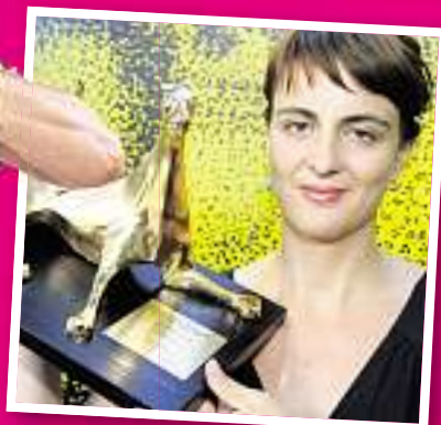
Andrea Staka (34) gewann 2006 mit «Das Fräulein» als erste Schweizer Regisseurin den «Goldenen Leoparden» des Filmfestivals Locarno.