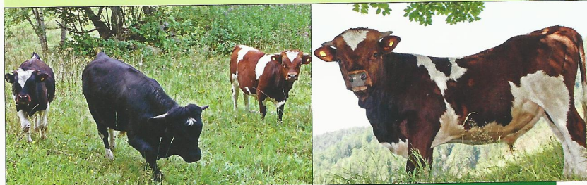
Die Stiere Linus, Karibu und Aram kommen in der Decksaison 2015 zum Einsatz.

In Ammern werden seit Jahren Stiere für den Natursprung gezüchtet, wie auch Stiere, die bei Swiss Genetics zur künstlichen Besamung abgesamt werden. Diese Tiere werden immer vom Zuchtleiter bestimmt. Gefragt sind vor allem Tiere, deren genetische Präsenz sich vom Durchschnitt abhebt und dessen Inzucht-Koeffizient tief liegt.